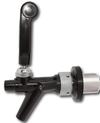
SELBACH PREMIX-ZAPFHAHN MIT RÜCKHOLFEDER